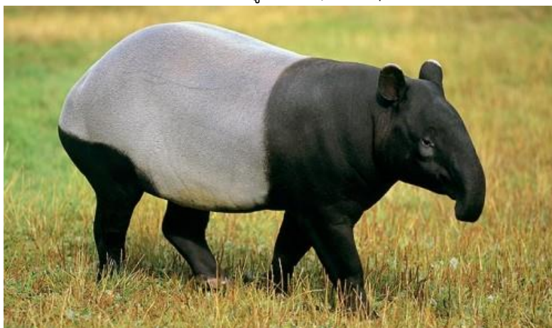
สมเสร็จจมาลายู ( Malayan tapir )

สมเสร็จจมาลายู เป็นสัตว์เลี้ยงลูกด้วยนมในอันดับสัตว์กีบคี่ นับเป็นสมเสร็จชนิดที่มีขนาดใหญ่ที่สุดและเป็นชนิดเดียวที่พบในทวีปเอเชีย เป็นสัตว์มีหน้าตาประหลาด คือ มีลักษณะของสัตว์หลายชนิดผสมอยู่ในตัวเดียวกัน มีจมูกที่ยื่นยาวออกมา