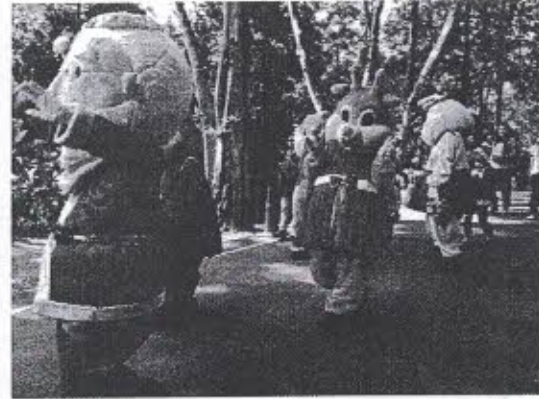
ภาพตัวอย่างการแสดงวันหยุดนักขัตฤกษ์