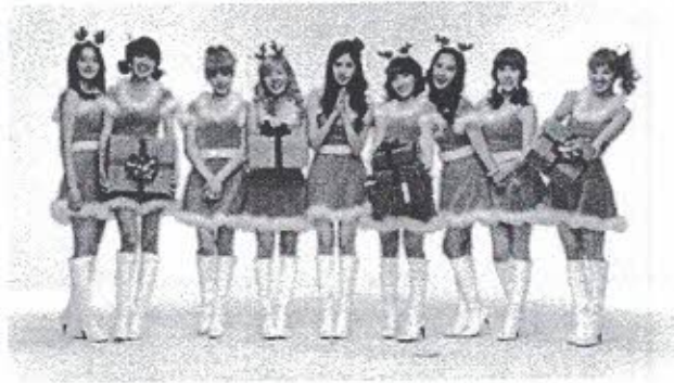
ภาพตัวอย่างการแสดงช่วงเทศกาล

ระหว่างวันหยุดต่างๆของชาวไทยที่เป็นช่วงวันหยุดยาว และวันหยุดนักขัตฤกษ์ จะมีนักท่องเที่ยวเข้ามายัง เชียงใหม่ไนท์ซาฟารีเป็นจำนวนมากจึงมีการจัดกิจกรรม การแสดงที่เป็นการแสดงพิเศษให้กับนักท่องเที่ยวได้รับชมอีกด้วย